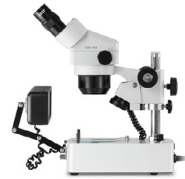
Vue de côté